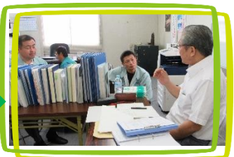
模擬マネジメントレビュー