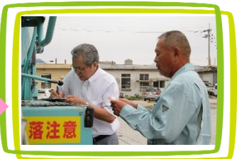
輸送係への聞き取り調査