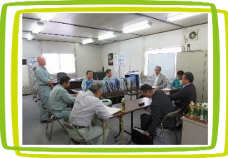
オープニング会議